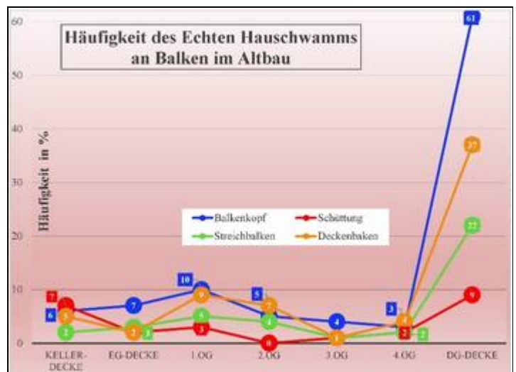
Abb. 2: Häufigkeit [%] des Echten Hauschwamms ( Serpula lacrymans ) im Altbau an ausgewählten Bauteilen in den Etagen (ohne Dach und Kellerboden/-Wände).

Ein besonderer Gefahrenpunkt im Altbau ergibt sich aus der Verlegung von Laminat und ähnlichen undurchlässigen Belägen im Erdgeschoss und Souterrain. Wird ein solcher Belag bei Feuchteproblemen auf eine bestehende Holzkonstruktion gelegt, ergibt sich für Fäulepilze ein günstiges Mikroklima unter dem Belag. Oft siedeln sich dann oft Hausfäulepilze an. Ohne eine Prüfung, ob Feuchteprobleme vorliegen, sollten undurchlässige Beläge nicht auf Holzkonstruktionen verlegt werden.