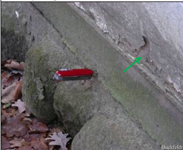
Abb. 7: Schwelle mit starkem Fäuleschaden – das Messer ließ sich ohne viel Kraft in der äußerlich unauffällig aussehenden Schwelle versenken; Hinweise darauf, dass etwas nicht in Ordnung ist, geben die Putzschäden (Pfeil).