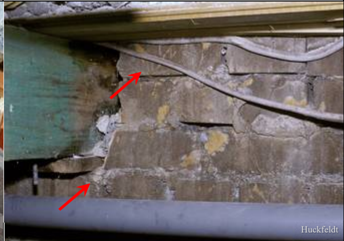
Abb. 6: Fauler Balkenkopf in einem feuchten Unterbodenraum unter dem Erdgeschoss mit Strängen an der Wand (Pfeile); ein PVC-Bodenbelag (nicht zu sehen) hat dazu beigetragen, dass der Boden nur schlecht abtrocknen konnte.