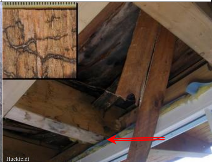
Abb. 8: Unter Flachdächern liegen oft verborgene Fäuleschäden, verborgen unter Folien (Pfeil); bemerkt werden die Schäden durch ablaufendes Wasser oder Durchbiegungen; Eckbild: Stränge eines Kellerschwamms.