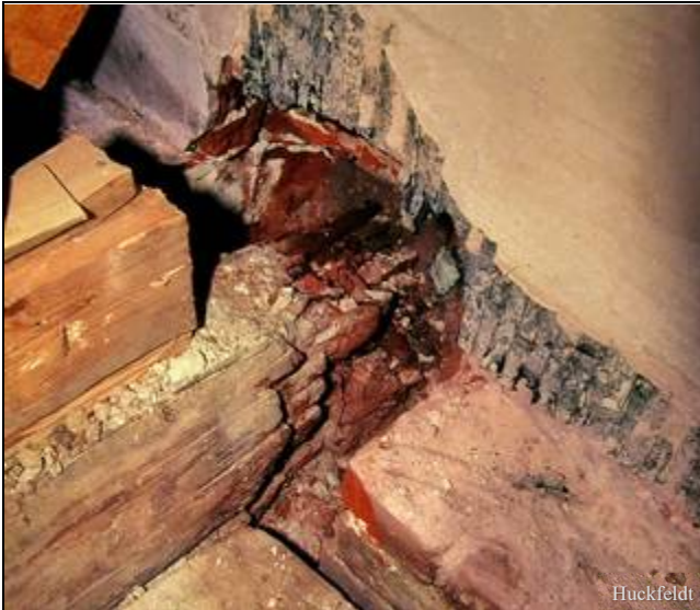
Abb. 3: Braunfauler Balkenkopf in einer Gebäude-Außenwand; die schwarze Kunststoff-Innenabdichtung hat zur Befeuchtung des Holzes beigetragen.