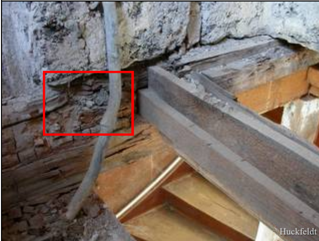
Abb. 5: Braunfauler Streichbalken (Kasten) unter einem Bad nach Rückbau; Undichtigkeiten der Duschtasse haben zu einer Durchfeuchtung des Balkens geführt und in der Folge haben sich Fäulepilze angesiedelt.