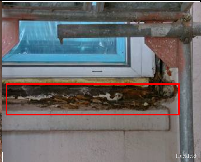
Abb. 4: Faules Füllholz unter einem Kunststoff-Küchenfenster; eine Teil-Sanierung hat zu einer Taupunktverschiebung geführt, so dass das Holz durch Kondensat satt-nass wurde und unangenehm roch.